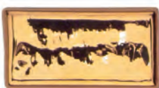
Bright Gold 10% HTL 2