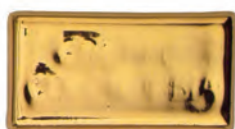
Lemon Gold 10% HTL 3