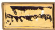
Bright Gold 8% HTL 1