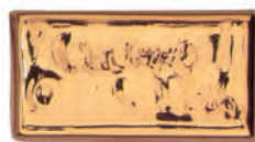
Bright Gold 12% HTL 8