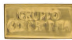
Matt Gold 18% HTL 6